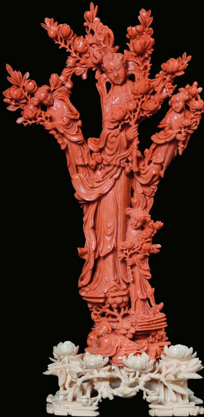
42 GRUPPO IN CORALLO ROSSO CON QUATTRO GUANYIN CON RAMI FIORITI, CINA, DINASTIA QING, XIX SECOLO gr: 608, h cm 27 A red coral 'four Guanyin with blooming branches' group, China, Qing Dynasty, 19th century € 8.000 - 10.000