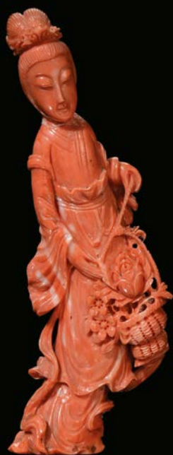
2 FIGURA DI GUANYIN IN CORALLO, CINA INIZIO XX SECOLO gr: 97, h cm 13,5 A coral figure of Guanyin, China, early 20th century € 700 - 800