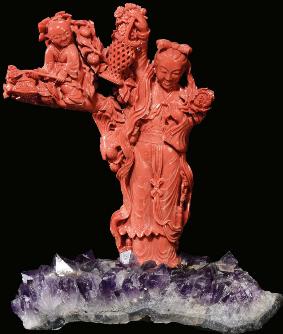
41 GRANDE GRUPPO IN CORALLO RAFFIGURANTE GUANYIN CON FANCIULLO, CINA, DINASTIA QING, FINE XIX SECOLO h cm 23,5

A large coral 'Guanyin with boy' group, China, Qing Dynasty, late 19th century € 10.000 - 12.000