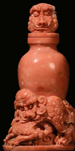
1 VASETTO IN CORALLO CON ANIMALE FANTASTICO, CINA INIZIO XX SECOLO gr: 90, h cm 8 A small coral "imaginary animal" vase, China, early 20th century € 1.000 - 1.200