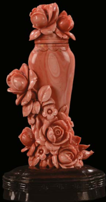
3 PORTA PROFUMO IN CORALLO CON DECORO FLOREALE, CINA INIZIO XX SECOLO gr: 262, h cm 14 A small red coral vase with floral decoration, China, early 20th century € 1.200 - 1.500